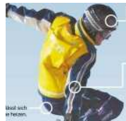
Gerade für Sportler sind intelligente Textilien interessant.

DÜSSELDORF. Eisig klamme Finger, Wind pfeift um die Ohren und vor lauter Schnee kann der Skifahrer kaum noch den Abhang erkennen. Plötzlich spürt er Tiefschnee unter den Brettern – und kommt von der Piste ab. Skifahreralltag? Von wegen. Die Forschung hat Wege gefunden, Wintersportlern derartige Situationen zu ersparen. Ausrüster wie Atomic haben beheizbare Skischuhe im Angebot, Reusch liefert dazu passende Handschuhe und die Unterwäsche von WarmX sorgt dank integriertem Akku für Wärme. Die GPS-Jacke von O'Neill weist Skifahrern den Weg. Und mit einem Helm mit Funkübertragungstechnik Bluetooth, wie ihn Burton auf den Markt gebracht hat, lässt sich telefonieren. Viele solcher Neuheiten werden auf der Computermesse Cebit im März zu sehen sein.